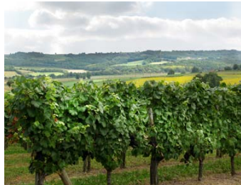
Blick vom Keller in die hügelige Landschaft im Madiran