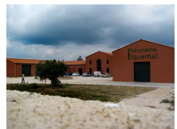
Nur äußerlich: Dunkle Wolken

Trauben. In verschiedene Richtungen gehen die Linie Terres Grillées und les Collines Oubliées: Während Collines Oubliées die Linie Tradition, Chants des Frères weiterentwickelt, steht hinter Terres Grillées eine neue Philosophie: „Moderne“ Weine, die durch eine andere Kombination von Rebsorten und die Möglichkeiten einer optimalen Vinifikation vor 30 Jahren nicht denkbar waren, die etwas Neues sind. Und dann sind darüber noch die Weine, die man als Purist als modisch abqualifizieren könnte - wäre das angesichts der Tatsache, dass sie gefallen, nicht doch ein wenig philisterhaft. Probenotizen S. 19