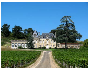
Château Fonplégade - so stellt man sich ein Château vor